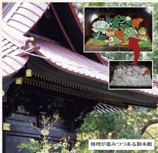
修理が進みつつある御本殿