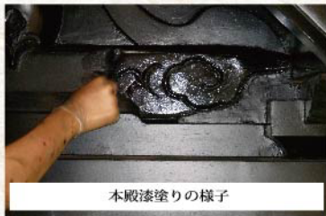
本殿漆塗りの様子