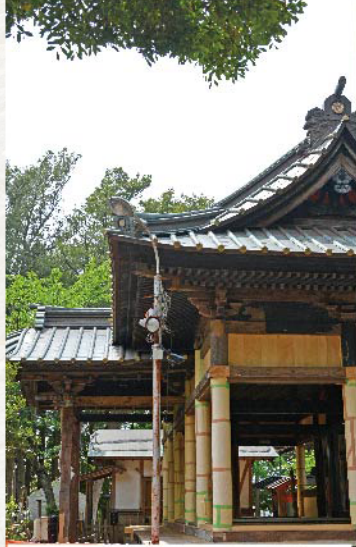
平成 26 年 5 月現在 工事中の御社殿