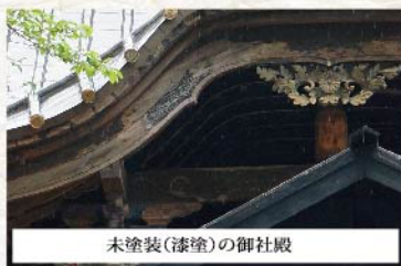
未塗装(漆塗)の御社殿